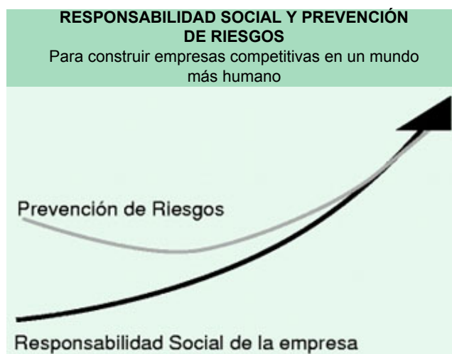
Figura 6 Desarrollo integral de la Prevención y la Responsabilidad Social

De acuerdo a lo que se pretende representar en la fig. 6, la prevención de riesgos laborales y la mejora de las condiciones de trabajo habrían de mejorar en un futuro en sociedades como la nuestra, al amparo de una mejor concepción de su significado y de su valor, así como de su integración al creciente interés por la Responsabilidad Social empresarial. Es de esperar que con políticas acertadas en este campo se ha de favorecer la construcción de empresas más competitivas en un entorno más humano.